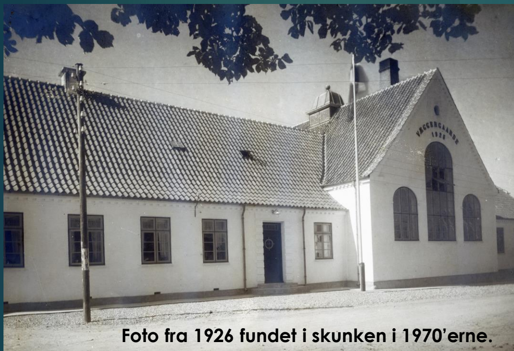
Foto fra 1926 fundet i skunken i 1970'erne.

Det første andelsmejeri i Himmerlandsgade blev bygget i 1897.