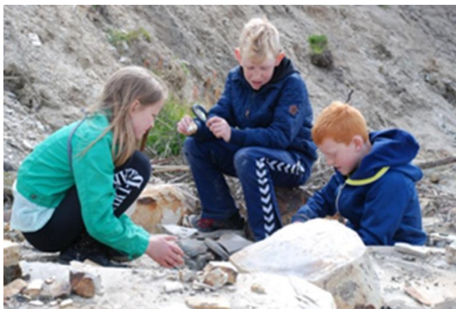
Kystens flora og fauna indgår i undervisningsforløb på Stenaldercenter Ertebølle

På baggrund af de seneste års erfaringer kan det konkluderes: Ved det nuværende aktivitetsniveau og bemanning ligger besøgstallet på ca. 5-6000 i ca. 220-240 undervisningsforløb, hvoraf 30-40 er for børn med ”særlige behov”.