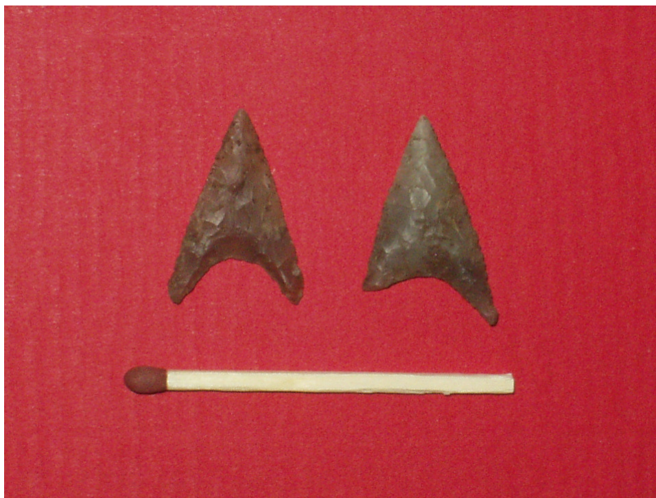
Pilespidser fra centralgraven i gravhøjen på VMÅ 2450. De er fladehugget – en teknik, hvor flere hundrede meget små, fine "skæl" presses af flinten med en trykstock af f.eks. hjortetak.

På VMÅ 2450 blev der udgravet en meget nedpløjet gravhøj. Der var kun et ganske tyndt lag på ca. 40 cm tilbage af selve højfylden, men det var alligevel muligt at finde den centrale grav i højen. Højen var bygget i to faser, det betyder, at man på et tidspunkt har valgt at udbygge den oprindelige gravhøj. Udbygningen er sandsynligvis sket i forbindelse med, at man har foretaget yderligere en begravelse i højen. Men det var ikke muligt at finde andre grave end den oprindelige centralgrav pga. den kraftige nedpløjning af højen. Den oprindelige gravhøj havde en diameter på ca. 14 m. Ved foden af højen var der anlagt et 1-1,5 m bredt stentæppe som afslutning på højen. Siden hen er højen blevet udvidet til en diameter på ca. 20 m. Hvornår dette er sket vides ikke, men det er muligt at det er sket samtidigt med anlæggelsen af kult anlægget i den sidste halvdel af bronzealderen. Det kan dog også lige så vel være sket på et tidligere tidspunkt. Ved foden af den udvidede høj var der sat en randstensskæde af store sten, og udenfor denne var der gravet en lav smal grøft. I den oprindeligt byggede høj blev der som nævnt fundet en grav. Graven var 2,9 m lang og 1,8 m bred. Graven var meget forstyrret, og den må være blevet plyndret. Hvornår plyndringen har fundet sted, er det ikke muligt at udtale sig om. Det kan lige såvel være i oldtiden som i nyere tid. I den sydlige del af graven var der et uforstyrret parti. Her blev der fundet to fladehuggede pilespidser af flint.