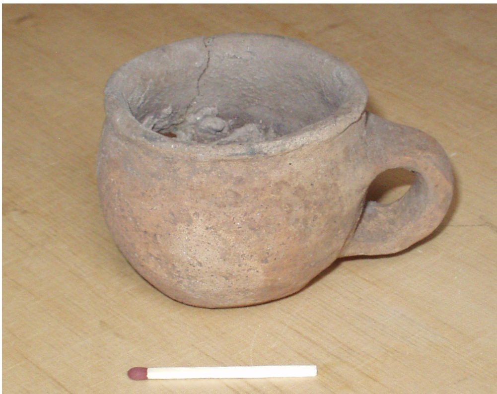
Kop fra grube i langhus på VMÅ 2450

Derudover blev der i stenlægningen mellem husene fundet en mortersten og flere sløjfede kværnsten. Mortersten har ligesom vore dages mortere været brugt til at støde bl.a. frø til madlavningen. De har typisk været placeret mellem ildstedet og husets vestgavl, altså i beboelsedelen af huset. Efter endt brug er morterstenen sekundært blevet anvendt i brolægningen. Det må forventes, at hegnet har været en del af et gårdsanlæg sammen med de to langhuse. Da gården endnu ikke er færdigudgravet, foreligger en hel præcis datering endnu ikke, men alt tyder på, at gården er fra ældre romersk jernalder (år 0 – 150 e.Kr.).