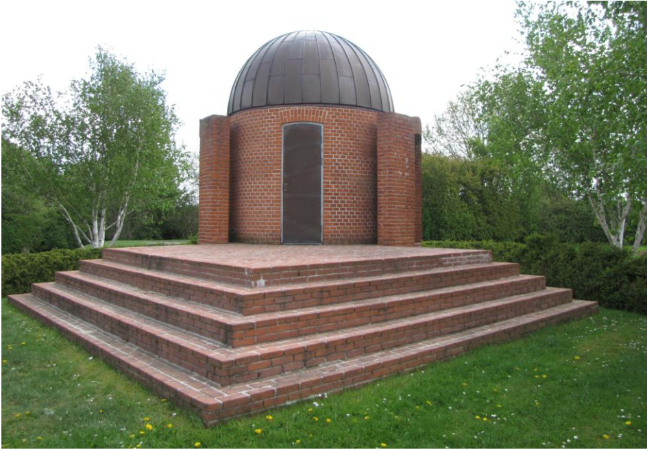
Observatoriet i skulpturpark ved Vesthimmerlands Gymnasium 1990

I skulpturparken er det tydeligt, at grundformerne cirkel og kvadrat går igen. Palle Rønne Møller skriver om Per Kirkebys murstensskulpturer: ”- at arkitekturens natur er at spejle det metafysiske, det kosmiske. Han kalder sine ting for ”dinosaur – de krystallinske dyr” og vil, at arkitekturen skal være en slags ”storslået kæmpeøglekunst”(” Den flotteste naturhistoriske metafor som er fostret, den der rummer alt livet: hvorfor uddøde de?”).”