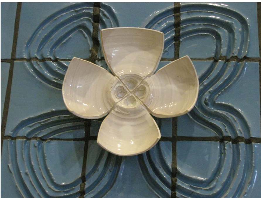
Udsnit af udsmykning