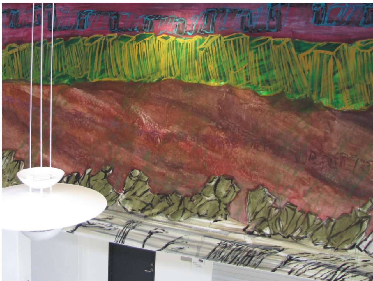
Maleri i foyer, Vesthimmerlands Musikhus, 2008

Tekst og fotografi af kunsthistoriker Maria Stensgård