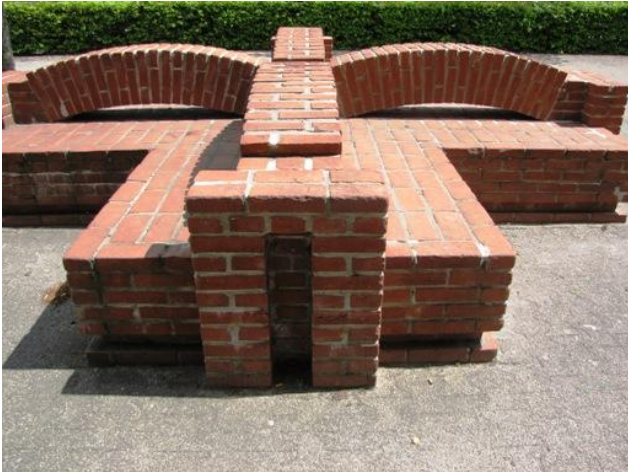
Murstensskulptur foran Vesthimmerlands Gymnasium, 1986