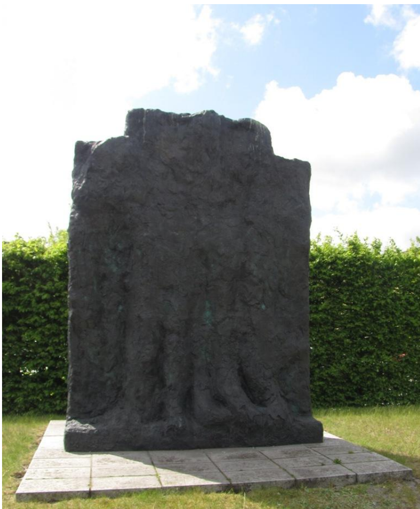
Uden titel (Herakles) 1991/1992

Bronzeskulptur foran Vesthimmerlands Gymnasium