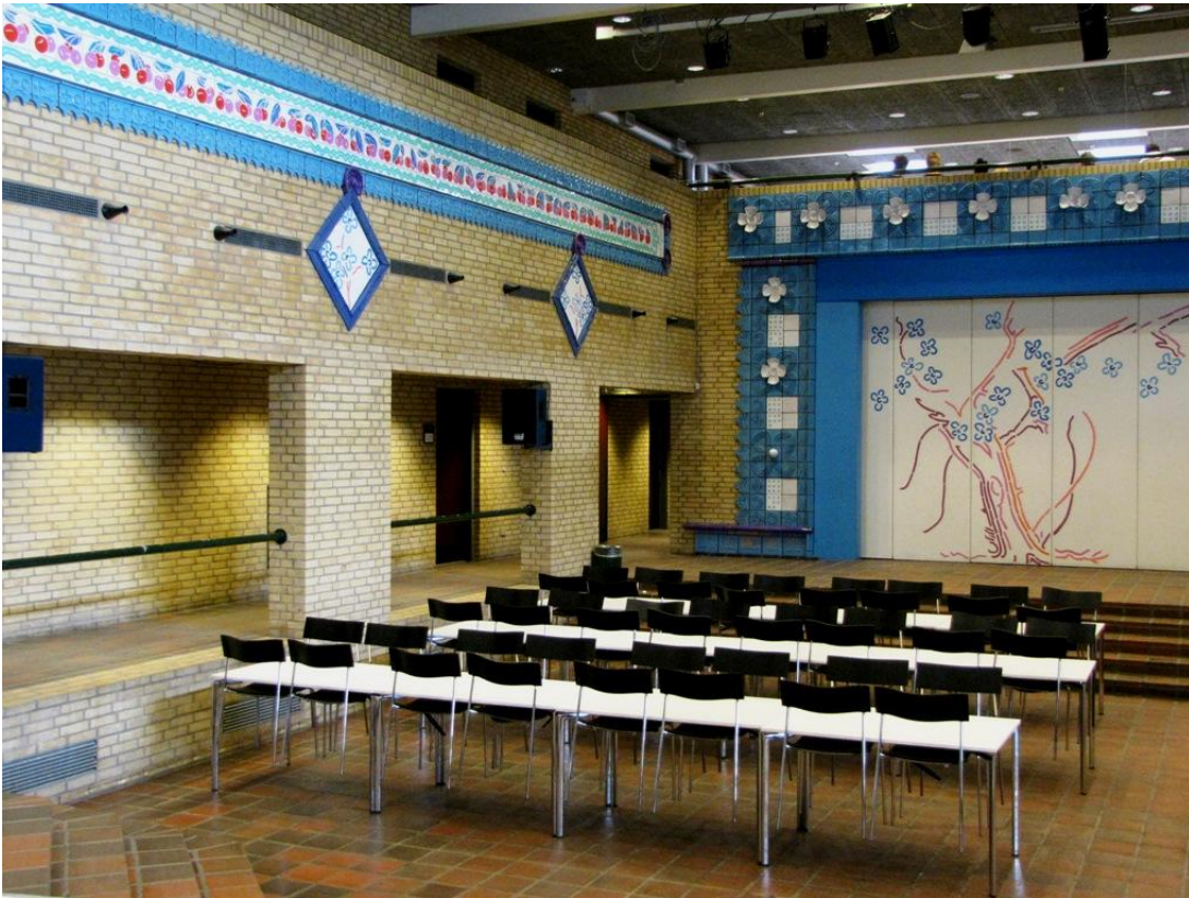
Poul Gernes udsmykker aulaen ved Vesthimmerlands Gymnasium sammen med elever, 1987