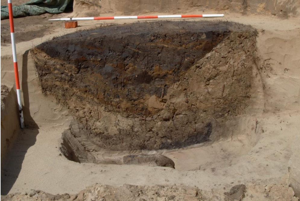
Den mulige brønd under genudgravning. Bemærk det oprindelige, mørke lag i bunden

400-500 meter nord for Stenildgårdgraven blev der i efteråret 2015, ligeledes på omfartsvejen, udgravet en mulig samtidig boplads – Pisselhøjudgravningen. Her blev fundet en nedgravet hustomt fra sen enkeltgravstid samt fem langhuse fra senneolitikum. Det er besnærende at tro, at der en eller anden samtidighed. Det er muligt, at beboerne herfra har været brugere af denne timber circle.