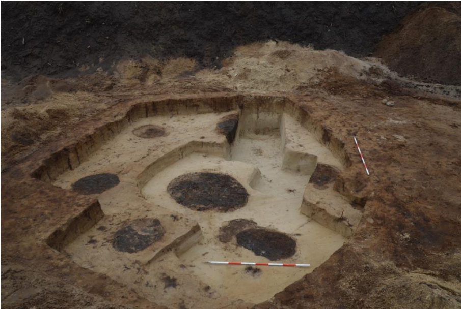
Stenildgårdgraven under genudgravning

Sammenligner man alene den indre cirkel og det centrale anlæg på Sarn-y-Bryn-Caled med den tilsvarende konstruktion ved Stenildgårdgraven, ses så store ligheder, at inspirationen til de to anlæg må have haft rødder inden for det samme kulturelle netværk.